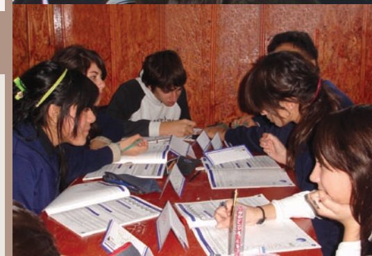
Alumnos en una de las clases especiales sobre bancos.